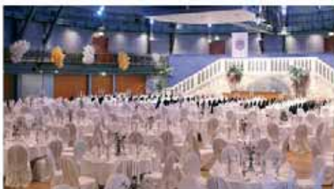
Venezianische Nacht im Großen Saal Venetian night at the ballroom