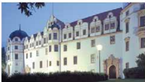
Celler Schloss Castle of Celle