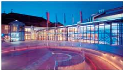
Congress Union Celle bei Nacht Congress Union Celle by night

The Congress Union Celle provides space for national and international events as well a professional service when organizing your event. We also offer a wide range of entertainment for incentives and caterings up to 1.800 guests.