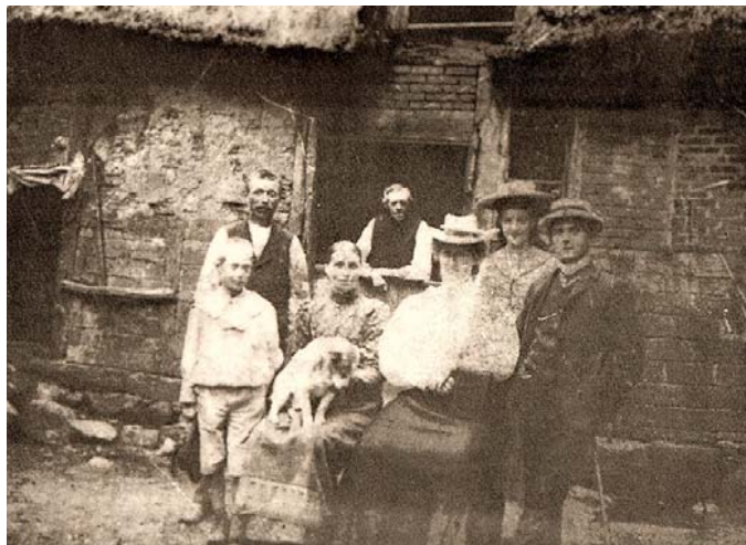
Die ersten Touristen aus der Stadt

Der Name beruht auf der hexenhausartigen verwinkelten Bauweise. Die Bezeichnung des Standortes „Höllenhoff“ weist auf die zahlreichen Stechpalmensträucher im umgebenden Eichenwald hin (von „Hülse“ oder „Holler“ für Ilex. Engl. „Holly“).