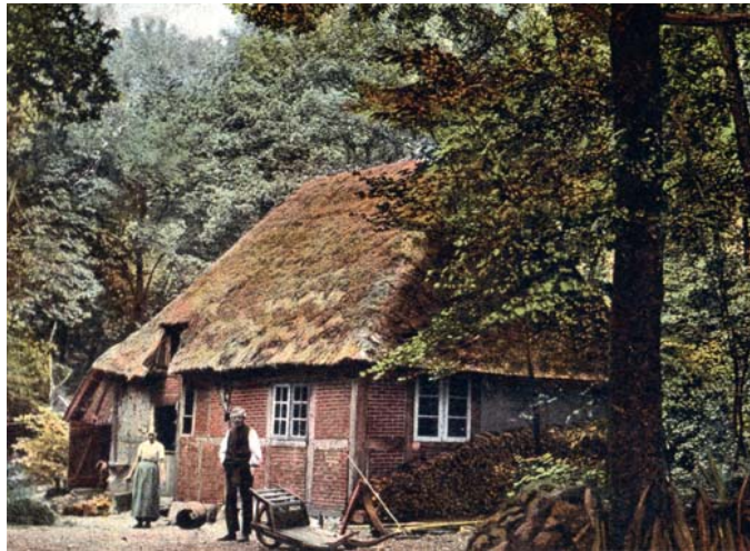
Postkartenmotiv ca. 1898

Das Hexenhaus ist ein ausdrucksvoller Zeuge örtlicher Wirtschafts- und Wohnverhältnisse der vergangenen drei Jahrhunderte. Es wird von der Landesdenkmalbehörde als schützenswertes Einzeldenkmal geführt.