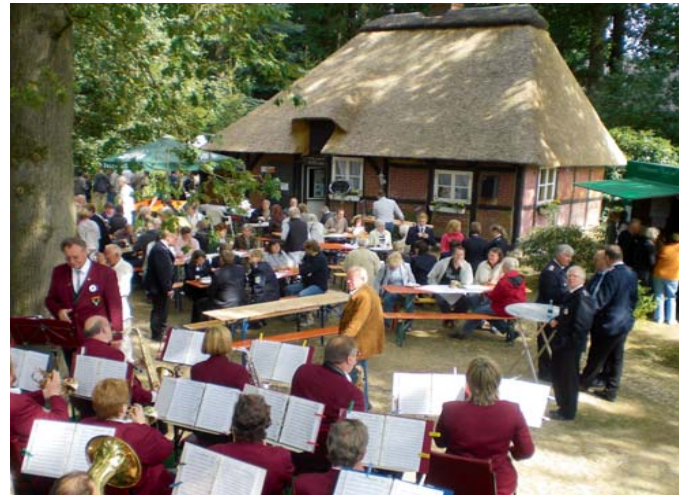
Dorffest am Hexenhaus