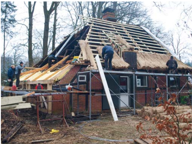
Ein neues Reetdach für das Hexenhaus