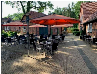
Hotel Am Kloster Wienhausen