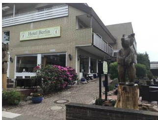
Akzent Hotel Berlin