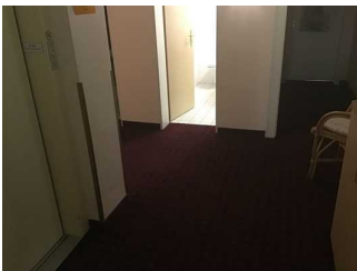
Weg vom Aufzug / Treppenhaus zum Öffentlichen WC