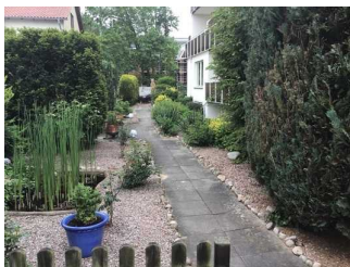
Weg vom Parkplatz zum Eingang