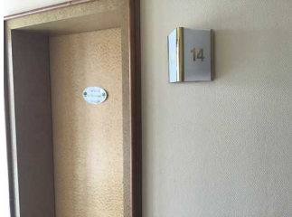
Mantelbogen visuell taktile Gestaltung