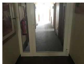
Wege Eingang zu Rezeption / Zimmer