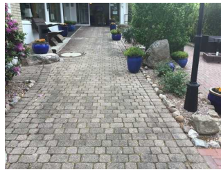
Weg vom Parkplatz zum Eingang