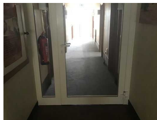
Wege Eingang zu Rezeption / Zimmer