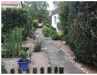
Weg vom Parkplatz zum Eingang