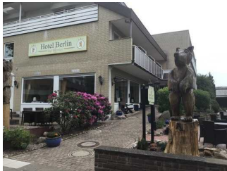
Akzent Hotel Berlin