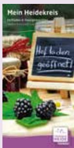
Hofläden & Hausgemachtes