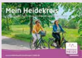
23 Radtouren durch die Erlebniswelt