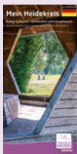
Kunst & Kultur mittendrin & drumherum