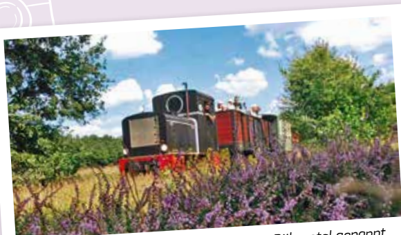
Die „Wilde Erika“ – so wird die alte Lok im Böhmetal genannt...