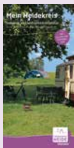
Camping- & Wohnmobilstellplätze