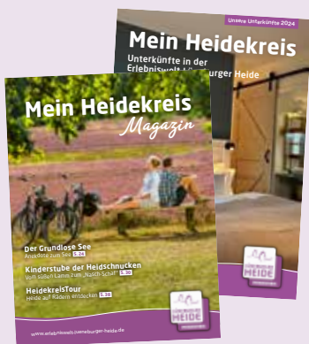
Mein Heidekreis Magazin inkl. „Unterkünfte 2024“ als Einleger