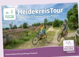
HeidekreisTour Entdecke in 13 Etappen unsere Region