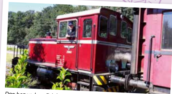
Das besondere Erlebnis – der historische „Heide-Express“ verbindet Heide und Hanse