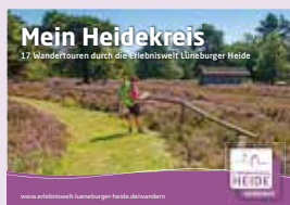
17 Wandertouren durch die Erlebniswelt